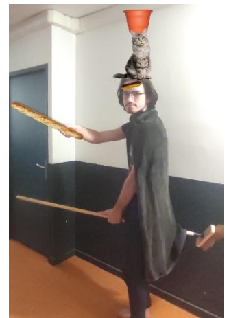
Petite exemple sympathique de costume (fait en partie à l'ordi veuillez nous en excuser)

Et voilà ! Tu as donné toutes les informations nécessaires à notre bon vieux choixpeau, à présent laisse-la magie opérer ! Reste plus qu'à nous envoyer tout ça avant septembre par la poste à l'adresse BDE INSA Lyon, 20 avenue Albert Einstein, 69100, Villeurbanne en précisant bien « équipe CDP » comme destinataire.. On va te dégoter un parrain/une marraine digne de l'apprenti sorcier que tu es. N'hésite pas à passer sur le groupe Facebook pour n'importe quelle question et à te promener sur le meilleur des sites d'inté ! On te souhaite de bonnes vacances et on espère que tu es prêt pour la meilleure rentrée de ta vie.